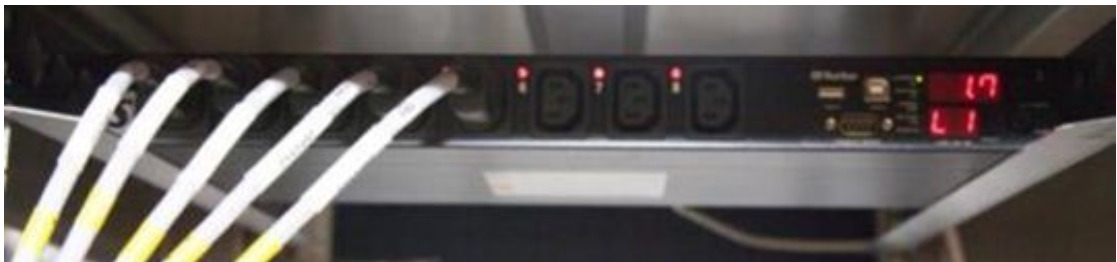
Abbildung 2.3: Die Power Distribution Unit

Die PDU sorgt dafür, dass alle Einheiten in der richtigen Reihenfolge ein- und ausgeschaltet werden und dass Hochleistungsgeräte mit geeigneten Zeitverzögerungen eingeschaltet werden, um den Einschaltstrom des Systems zu begrenzen.