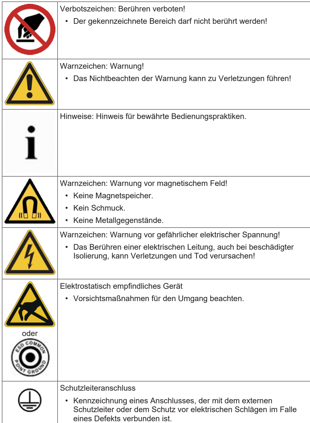
Tabelle 1.2: Zeichen und Schilder