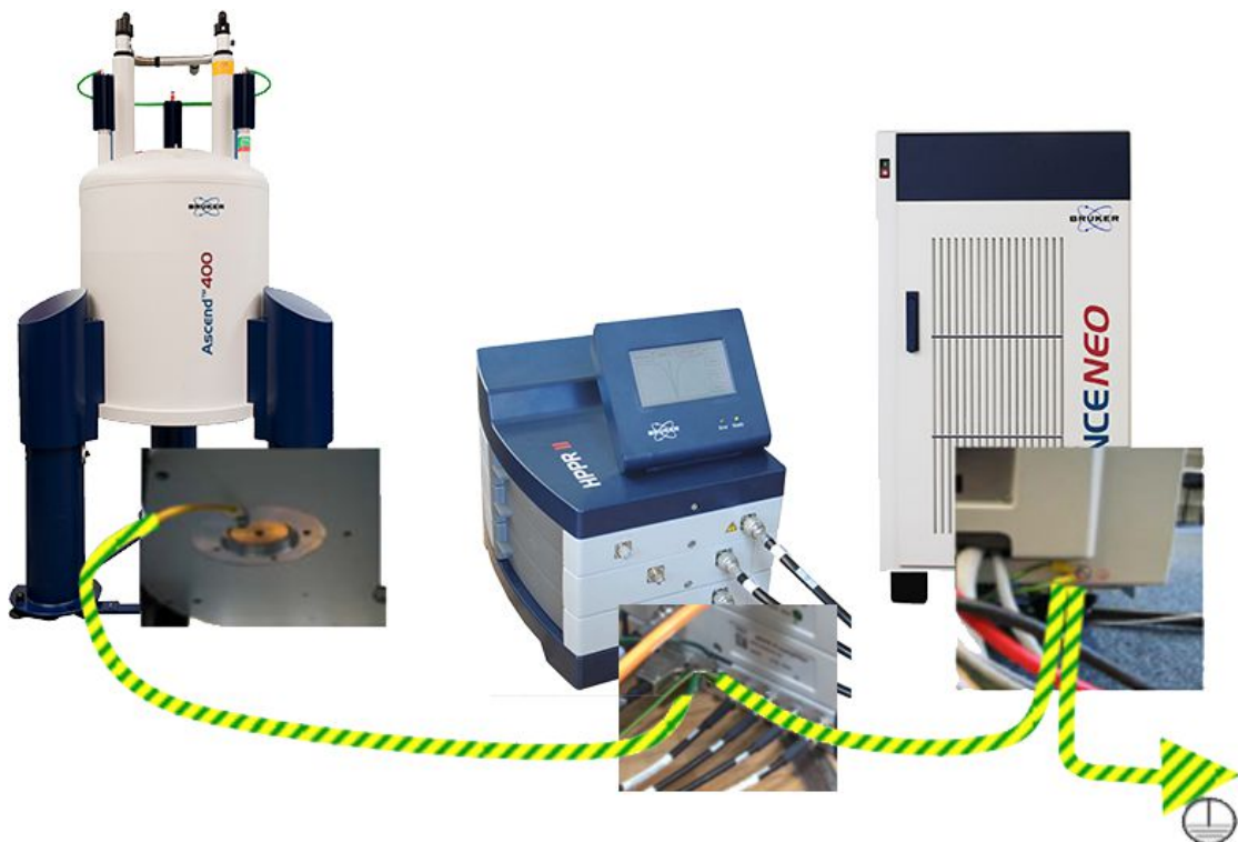
Figura 2.2: Espectrómetro AVANCE con preamplificador externo (HPPR/2)