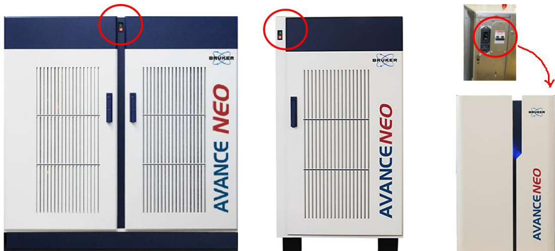
Figura 2.5: Ubicación del dispositivo de apagado de emergencia en la serie AVANCE NEO

El interruptor de corriente apaga la consola, incluida la PDU, tras un apagado controlado. El interruptor de corriente de las consolas AVANCE también sirve de APAGADO DE EMERGENCIA, por ejemplo, si no es posible un apagado controlado a través de la PDU.