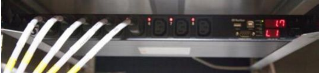
Figura 2.3: La unidad de distribución de potencia

La PDU se encarga de que todas las unidades se enciendan / apaguen en el orden correcto y de que las unidades de alta potencia se enciendan con retardos de tiempo adecuados para limitar la corriente de entrada del sistema.