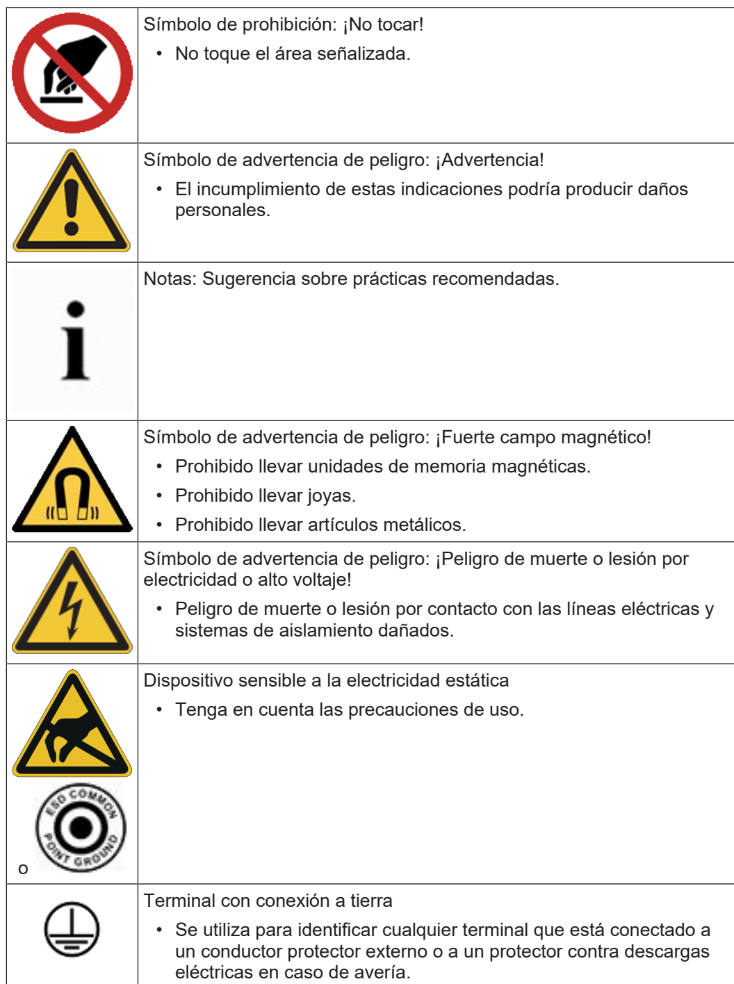
Tabla 1.2: Símbolos y etiquetas